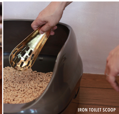
IRON TOILET SCOOP