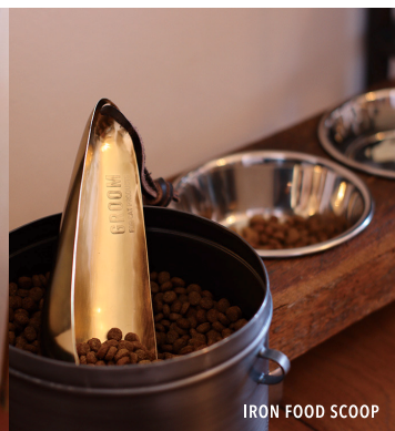
IRON FOOD SCOOP

玉ねぎのようなユニークな形状が魅力です。サイドの窓や上部の穴から寝顔などをのぞいていただくことができます