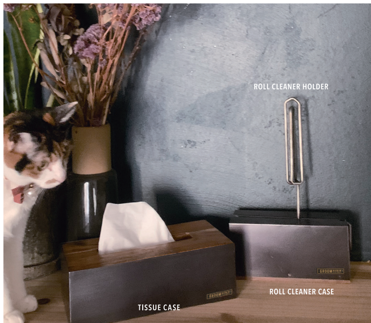
ROLL CLEANER HOLDER